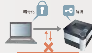
不正アクセスによる盗み見を防止

新コントローラーの搭載により、ネットワーク機能が強化されています。IPv6、IPsecやSSLへの標準対応でセキュリティー性が向上しています。