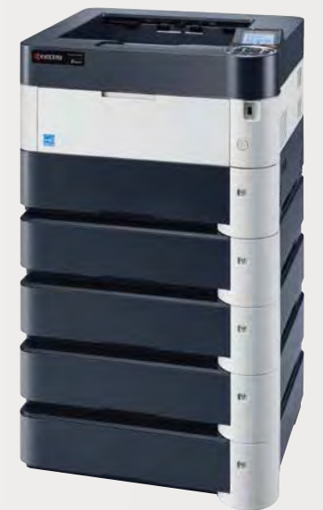
ECOSYS P4040dn + PF-4100 (OPTION) × 4