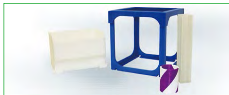
ブルーの造形物サンプルが、ほぼ300×300×300mmの大きさ。

パーソナル3Dプリンター最大クラスの300×300×300mmの造形エリアと、デュアルヘッド搭載で別色のフィラメントを使用した2色造形が行えます(フィラメント径は1.75mm)。ABS、PLAに加えサポート材としてPVAも利用可能です。