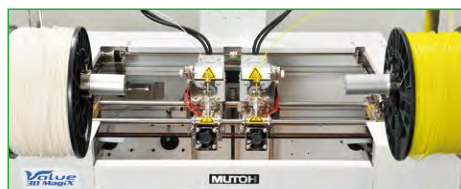
ボディ上部に搭載されたMUTOH自社開発 高速デュアルヘッド。