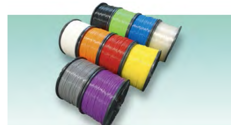
●豊富なカラーパリエーションのフィラメント

安全に関するご注意 商品を安全にお使いいただくため、ご使用前に必ず「取扱説明書」をよくお読みください。