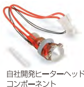
自社開発ヒーターヘッド コンポーネント

MF-2200Dは、2つのヘッドを個別にコントロール。一つのヘッドが作業を終了すると造形エリアから離れて待機するデュアルキャリッジ方式を採用。自社開発のヘッドが、高い熱容量を安定的に維持出来ることと、軽量化による軸移動の高速化を加え、造形スピードを約1.2倍(当社比)まで高めました。