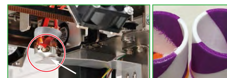
待機中のヘッドノズル(赤い円)を塞ぐシャッター(白矢印)の働きにより、つなぎ目のゴミの付着が低減している(写真右)。